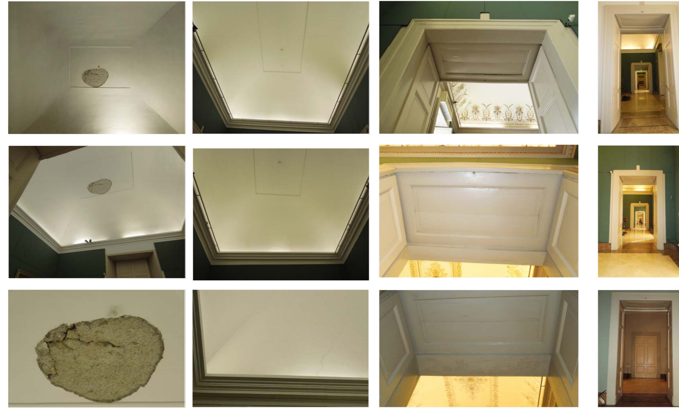
volta sala 22: